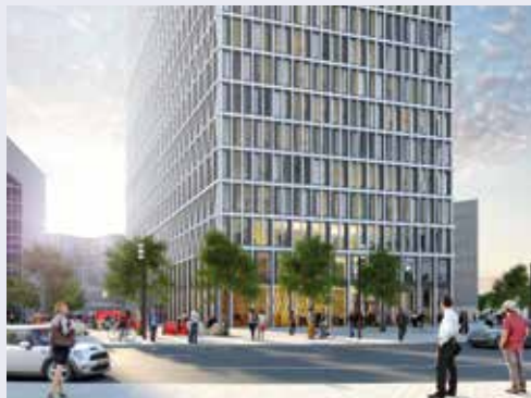
ONE