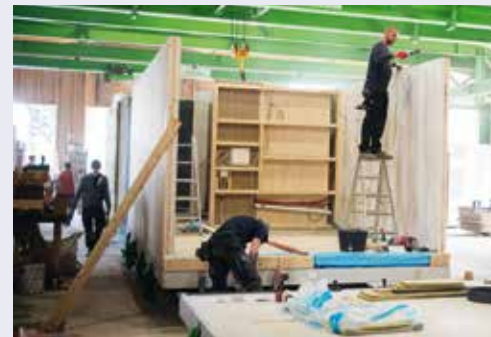
Arbeiten in der „Feldfabrik“